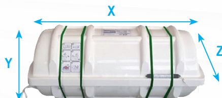
Compacto enrollable (GRP)