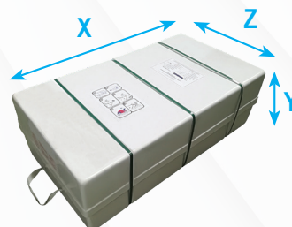
Compacto plano - 12 personas