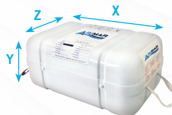
Compacto plano (ABS)